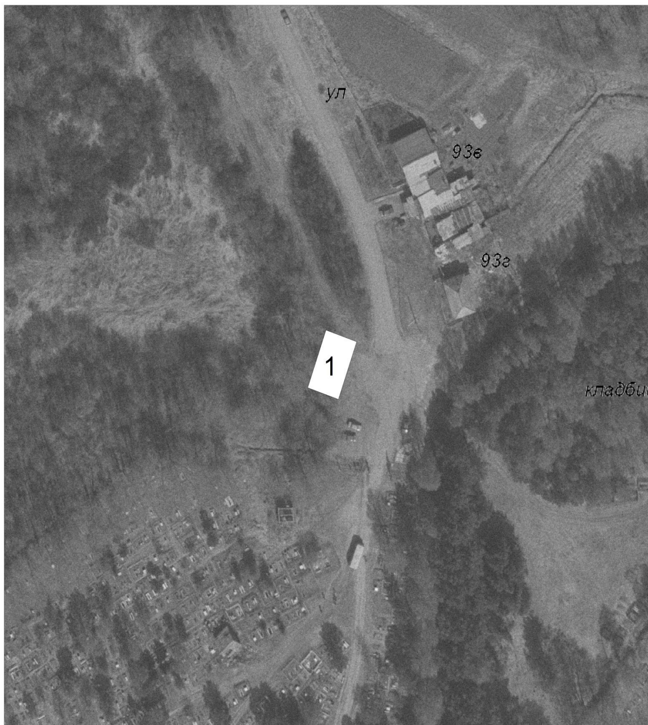
Схема размещения нестационарных торговых объектов и ассортиментный перечень продуктов на «Родительский день» 14 мая 2024 года с 9-00 о 17-00